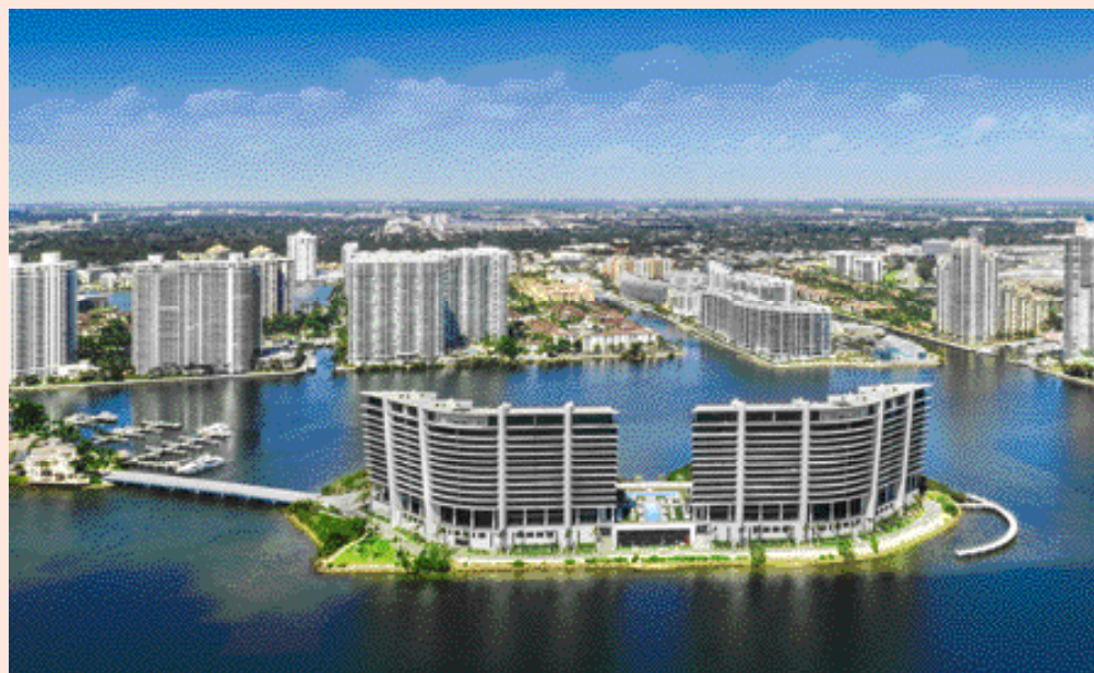
Privé島的兩座住宅建築，將包括160間公寓，以及健身中心和遊艇碼頭等