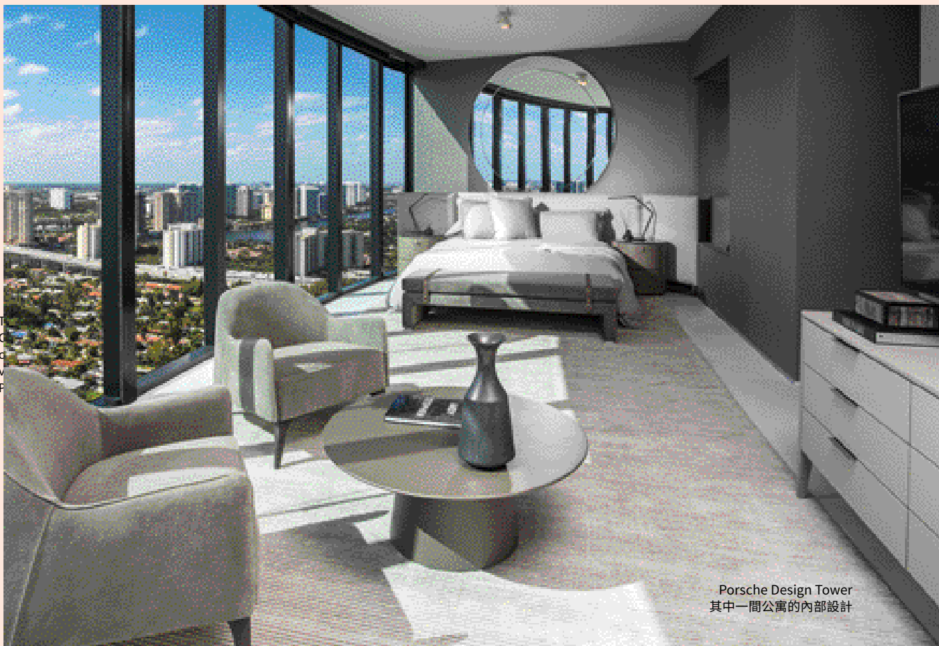
Porsche Design Tower 其中一間公寓的內部設計