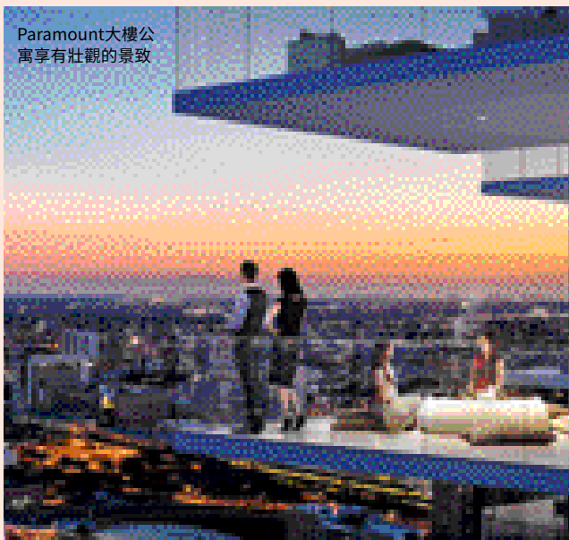
Paramount大樓公寓享有壯觀的景致