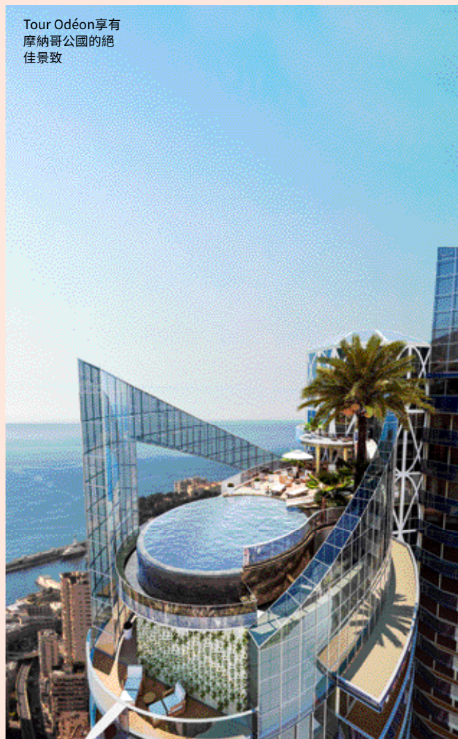
Tour Odéon享有摩納哥公國的絕佳景致

對於這樣一個寸土寸金的彈丸之地，精確的位置是最重要的，沒有一個比Golden Square更具代表性